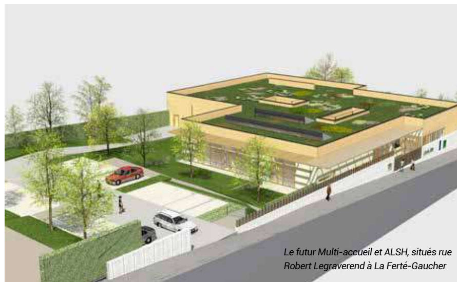
Le futur Multi-accueil et ALSH, situés rue Robert Legraverend à La Ferté-Gaucher