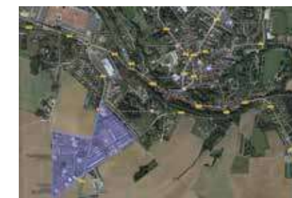
Zone d'Activités Économiques de La Ferté-Gaucher

de sélectionner des zones publiques classées comme destinées à l'accueil d'activités économiques dans les documents d'urbanisme et constituant une certaine homogénéité. Les zones répondant à la définition retenue ont été recensées, validées et sont situées à Rebaix et à La Ferté-Gaucher (Zone du Petit Taillis).