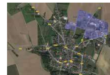
Zone d'Activités Économiques de Rebaix